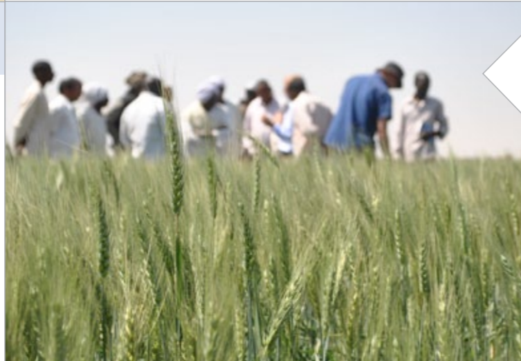
السودان | جنوب السودان