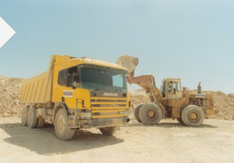
مصر | الجزائر | السودان | ليبيا

تهدف شركة القلعة إلى تعظيم الاستفادة من وفرة الموارد الطبيعية بأسواق القارة الأفريقية ومنطقة الشرق الأوسط، عبر بناء منظومة استثمارية متكاملة في مجالات متعددة تشمل إدارة المحاجر لمصانع الأسمنت، وتصنيع مواد البناء الصديقة للبيئة، وتوفير الطلب المحلي والعالمي على كربونات الكالسيوم المطابق للمواصفات الدولية، وغيرها من الخدمات الصناعية ذات القيمة المضافة.